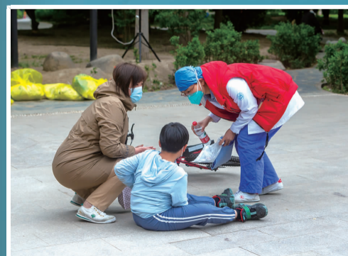
工作人员为孩子送上矿泉水