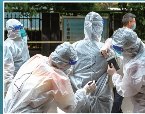
医护人员为彼此标上工作序号

难关难过也要关关过。让我们夯实信心、筑牢责任,守往来之不易的防控成果与美好安宁的城市生活。