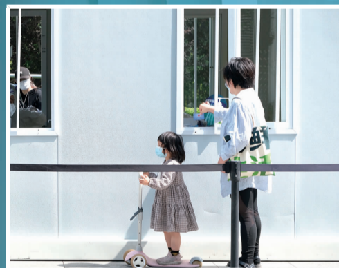
居民带孩子到便民检测点参加筛查